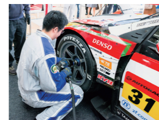
レース活動への参加