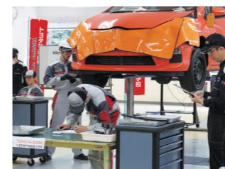
トヨタ3校整備コンテスト

各校約1,000人の在学生を有し、広く大きな敷地・校舎に食堂、寮、グラウンド(東京・神戸)、体育館(東京・名古屋)などの施設も充実しています。また、トヨタならではのイベントも含め、学生生活を豊かにする多彩な行事・研修も催行しています。