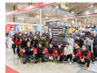
東京オートサロン/ 大阪オートメッセへの出展